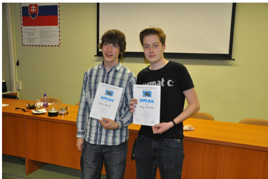
Prví dvaja v kategórii Zenit - elektronika, kategória A